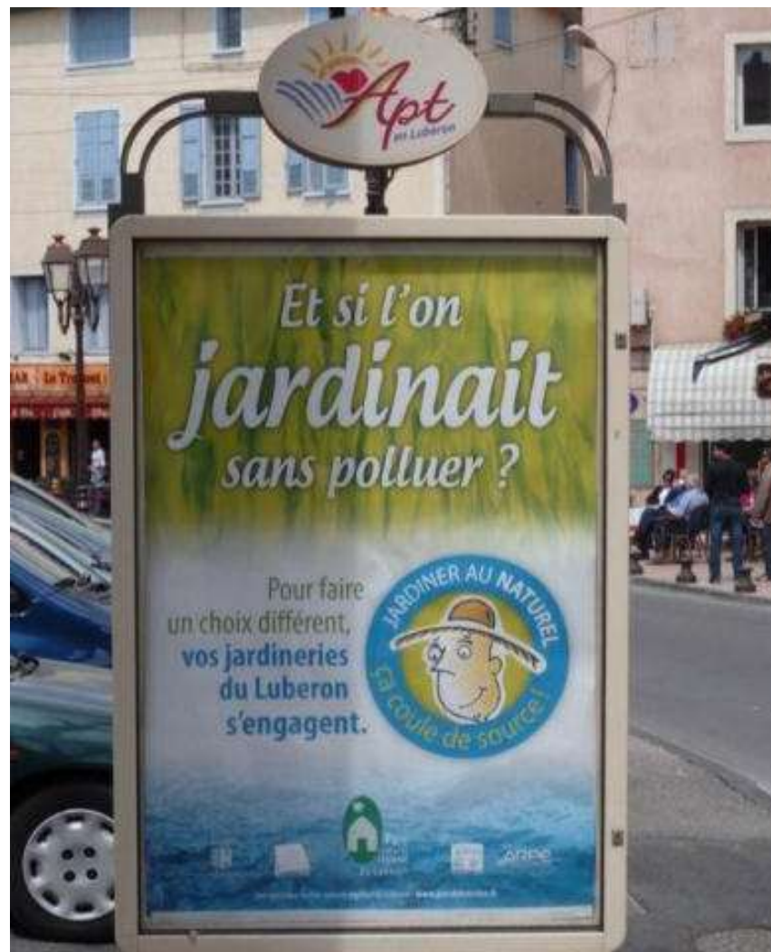
Affichage à Apt, Cavaillon, Robion et Manosque