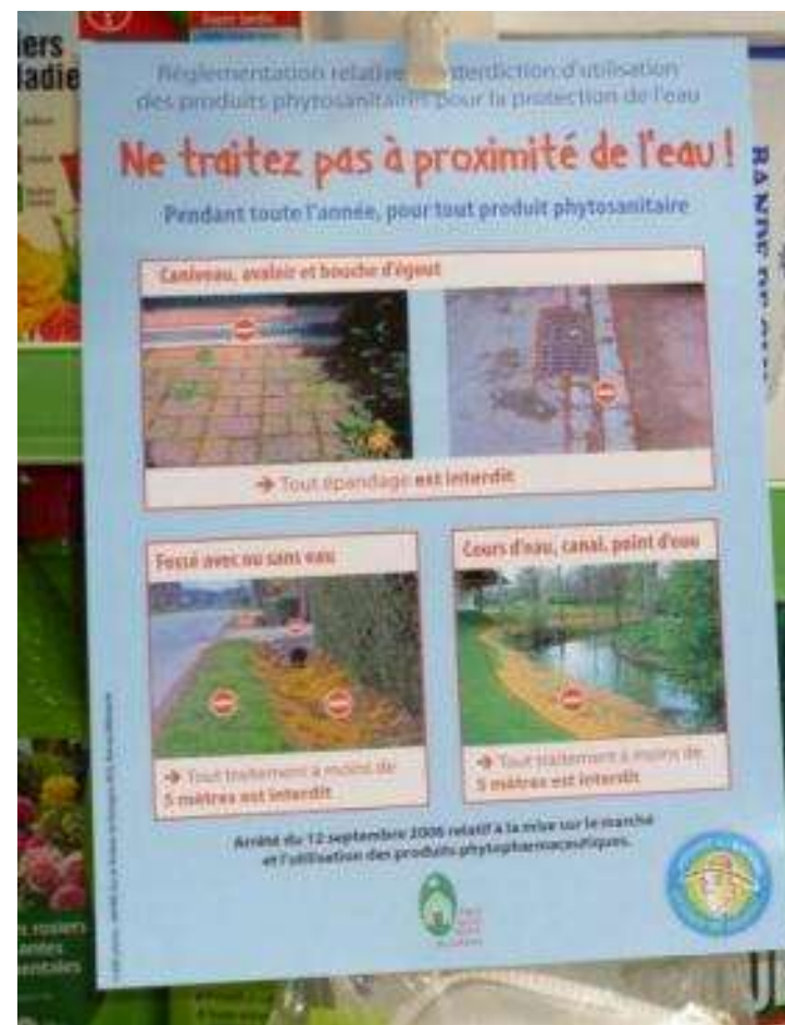
Affiches « opération » « magasin » et affiche réglementation