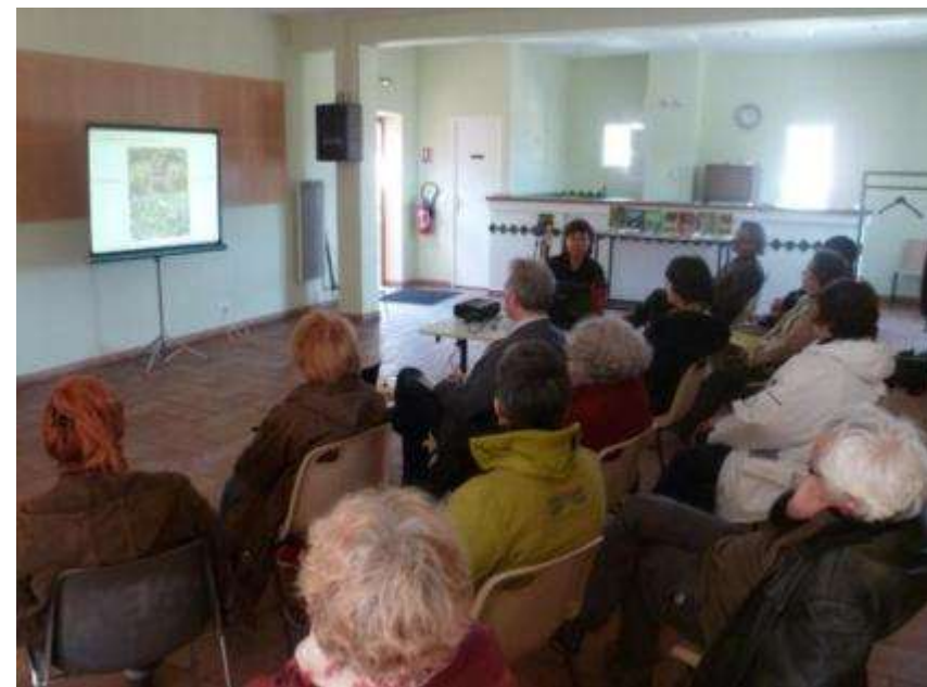
Réunion d'information pour les jardiniers amateurs