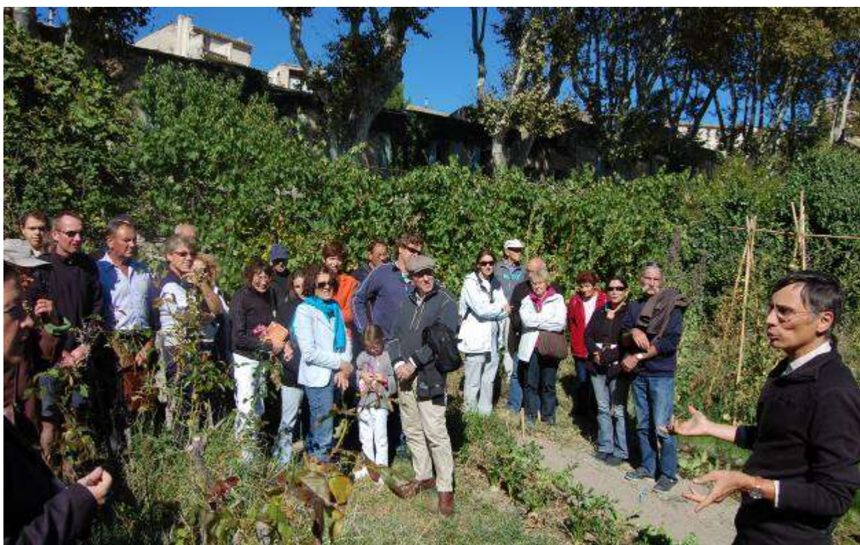
Visites de jardin exemplaire