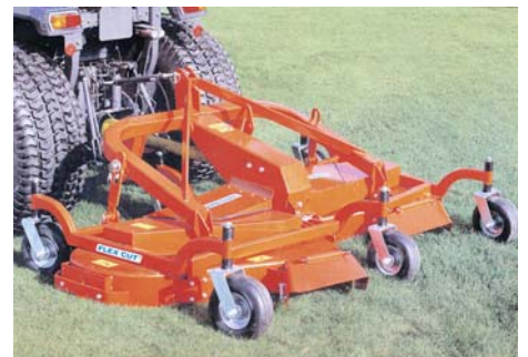
Plateau recycleur pour tonte avec mulching

Dans les espaces de prestige, pratiquer la tonte avec mulching permet de supprimer l'utilisation d'engrais et de désherbants chimiques. En effet, cette technique consiste à incorporer les produits de tonte dans le sol, ce qui l'enrichit et favorise certaines graminées, tout en éliminant les espèces "indésirables" (pâquerette, trèfle...) qui supportent moins les coupes fréquentes.