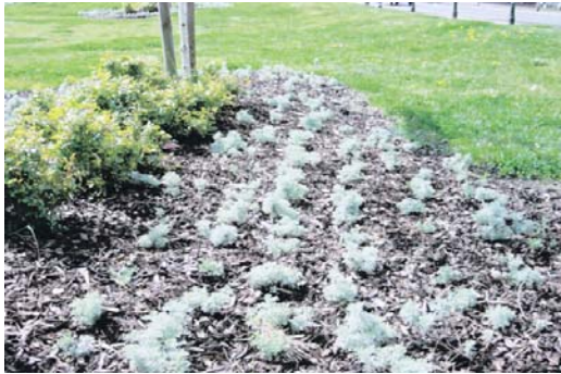
Paillage de massifs avec du mulch (copeaux de bois)

L'utilisation des plantes couvre-sol est aussi une alternative simple au désherbage.