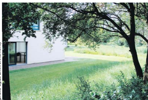
La zone de fauche participe à l'embellissement paysager Société Esterra à Lezennes

Coût moyen estimé pour 2 fauches annuelles : 2 x 0,15 € HT / m 2